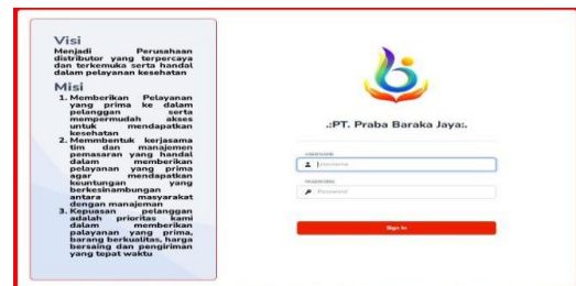
Gambar 2. Halaman Login

Halaman login merupakan tampilan awal pengguna untuk mengakses sistem. Halaman ini dirancang untuk memastikan bahwa hanya pengguna dengan hak akses yang dapat menggunakan sistem.