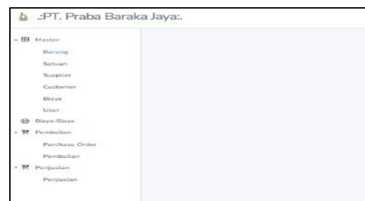
Gambar 3. Halaman dashboard

Halaman dashboard menampilkan ringkasan informasi yang berkaitan dengan persediaan barang. Melalui halaman ini pengguna dapat mengakses menu utama, seperti mengolah data barang, data supplier, transaksi pembelian, transaksi penjualan, dan laporan persediaan.