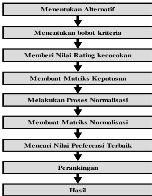
Gambar 2. Kerangka penelitian