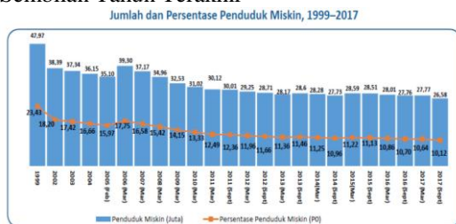
Tabel 1.1 Perkembangan Tingkat Kemiskinan Sembilan Tahun Terakhir

Catatan: Maret 2011-September 2013 merupakan backcasting dari penimbang proyeksi penduduk hasil Sensus Penduduk 2010 Sumber: Data dari data Survei Sosial Ekonomi Nasional (Susesnas)